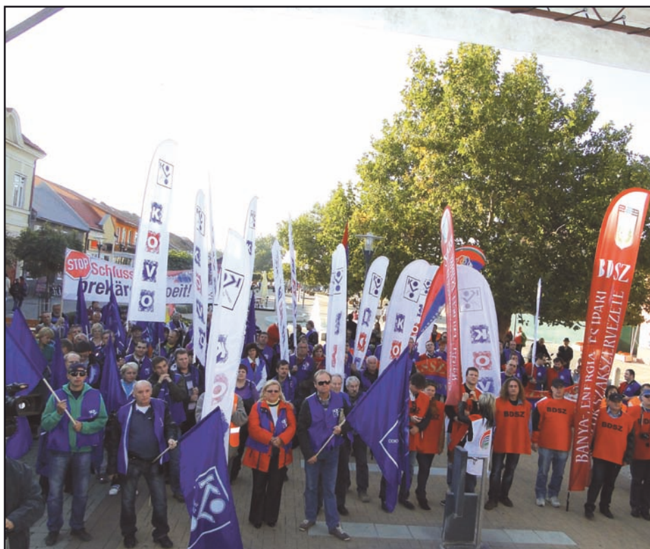
• Akciu podporili členovia OZ KOVO, IOZ a ECHOZ zo Slovenska, odborári z Maďarska a Rakúska.